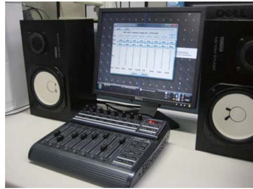
図2 フィジカルコントローラを併用した例。コントローラでの操作とディスプレイでの操作は連動しており、一方で音量などを操作するとその変更は他方に伝達される。

多重奏音楽音響信号をリミックスするためには音響信号を各楽器パートごとに分離する必要がある。このために、我々は調波・非調波等号モデル 6) を用いる。分離処理中のモデルパラメータ推定において、入力音響信号中の楽器音の奏法・音色個体差が推定精度に影響することを避けるため、複数の楽器個体・奏法で演奏した楽器音を学習データとしたモデルパラメータの事前分布を用いる。本分離手法は、何らかの手法 7)-9) を